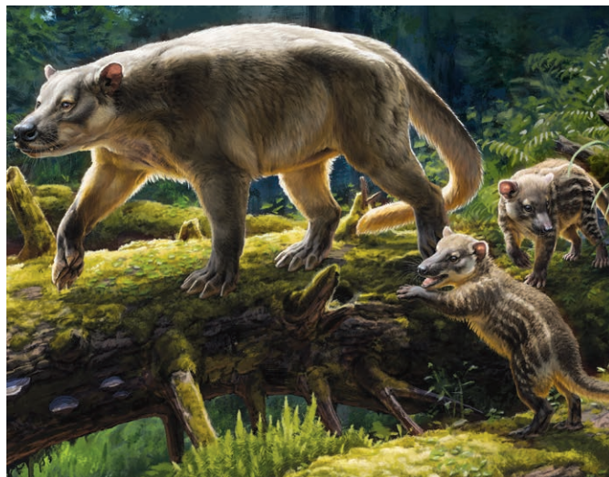
Illustration by Beth Zaiken

約6600万年前に起きた小惑星衝突によって恐竜が絶滅した際、哺乳類も9割以上が絶滅した。なぜ一部の哺乳類は生き延びることができたのか。近年の発見と新技術によって、大絶滅に耐えた哺乳類の姿がついに明らかになった。彼らの多くは白亜紀の哺乳類のなかでは少数派の真獣類で、小さくて雑食性だったようだ。