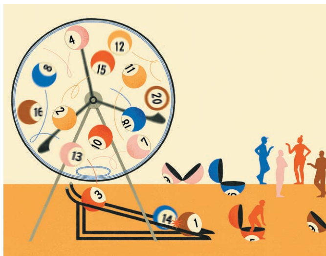
Illustration by Montse Galbany

市民会議は社会の重要な課題の解決を探る方法として成果をあげている。参加者はボランティアから人口構成を反映して抽選されるが、これまで一般的に使われてきた選出アルゴリズムは公平性に欠けていた。数理最適化の手法を用いた新しいアルゴリズムは、古代アテネの抽選機「クレロテリオン」を現代版にアップデートし、民主主義を後押しする。